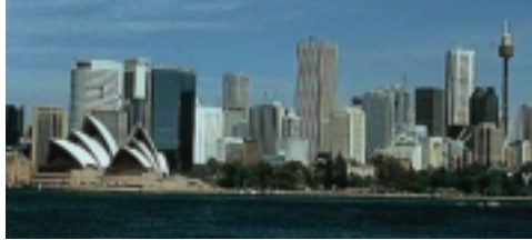
Sydney hiriko argazkia (Australia)